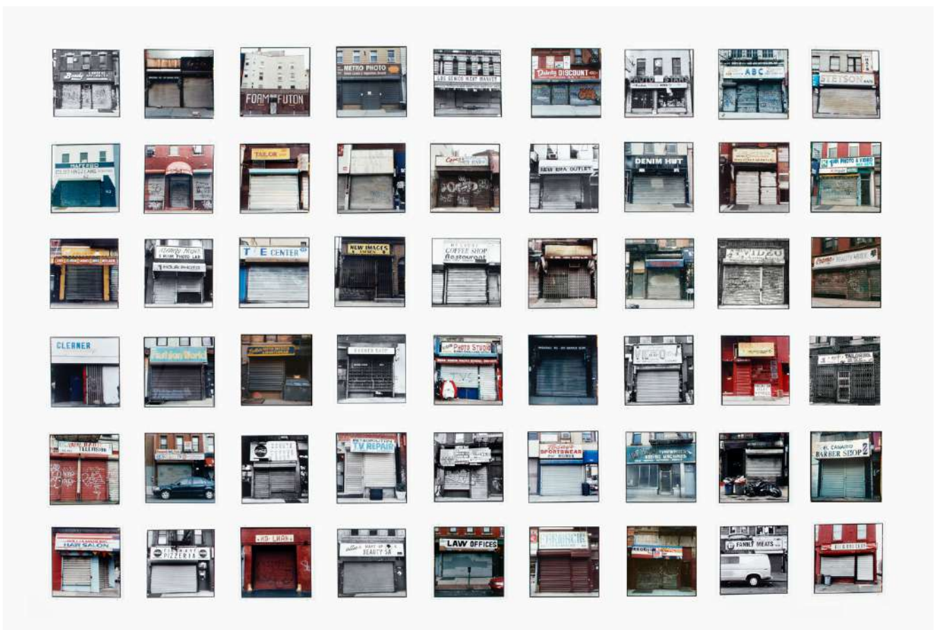
Zoe Leonard, Analogue , 1998-2009 (λεπτομέρεια), 412 χρωμογενικές εκτυπώσεις και αργυροτυπίες, 28 x 28 εκ. (η καθεμία). Ευγενική παραχώρηση της καλλιτέχνης και των γκαλερί Galerie Gisela Capitain, Κολωνία και Hauser & Wirth, Νέα Υόρκη.

Η Zoe Leonard (γεν. 1961) είναι Αμερικανίδα καλλιτέχνη η οποία ζει και εργάζεται στη Νέα Υόρκη. Η καλλιτεχνική της πρακτική συνδυάζει τη φωτογραφία, την γλυπτική και τις τοπο-ειδικές εγκαταστάσεις. Το έργο της Leonard έχει παρουσιαστεί εκτενώς από τις αρχές της δεκαετίας 1990. Το 2018 πραγματοποιήθηκε αναδρομική έκθεση του έργου της στο Whitney Museum of American Art της Νέας Υόρκης και στο Museum of Contemporary Art του Λος Άντζελες. Επιλεγμένες ατομικές εκθέσεις της έχουν παρουσιαστεί, μεταξύ άλλων, στους εξής χώρους: Musée d'Art Moderne de Paris, Παρίσι (2022)· Museum of Contemporary Art, Σίδνεϋ (2023)· Museum of Modern Art, Νέα Υόρκη (2015)· Chinati Foundation, Μάρφα, Τέξας (2013)· Camden Arts Center, Λονδίνο (2012)· Dia Art Foundation, Νέα Υόρκη (2008)· Museo Reina Sofia, Μαδρίτη (2008)· Kunsthalle Basel, Βασιλεία (1997)· και Vienna Secession, Βιέννη (1997). Η Leonard έχει συμμετάσχει στις διεθνείς εκθέσεις τέχνης 57 η Carnegie International (2018), Documenta 9 (1992), Documenta 12 (2007), καθώς και στην Μπιενάλε του Whitney τα έτη 1993, 1997 και 2014. Τα έργα της συμπεριλαμβάνονται σε σημαντικές δημόσιες συλλογές ανά τον κόσμο. Έχει λάβει διάφορα βραβεία όπως η Υποτροφία Guggenheim (2020)· το Graham Foundation Grant (2020)· το βραβείο Bucksbaum (2014) και το βραβείο Anonymous Was A Woman (2005).