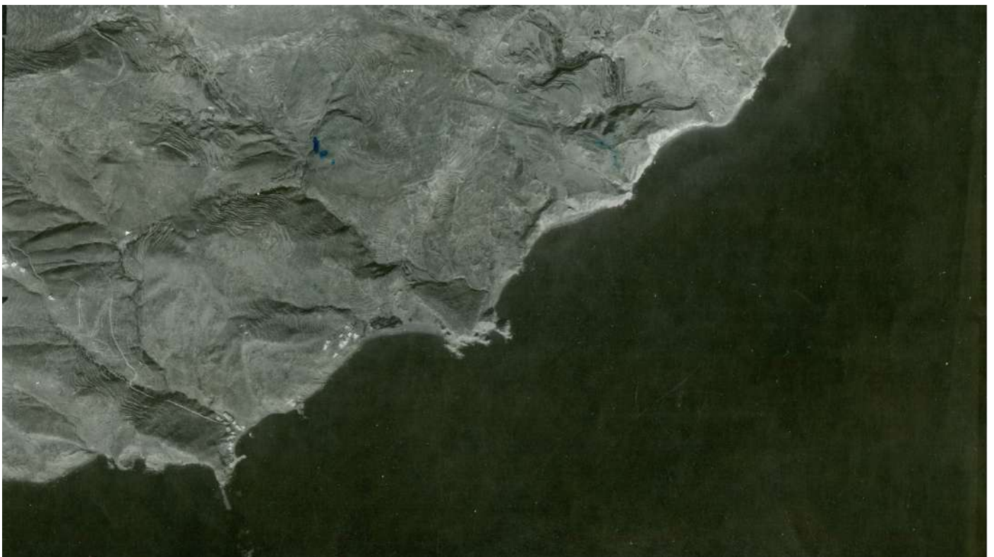
Αεροφωτογραφία που απεικονίζει το λιμάνι της Ανάφης, National Geographic Service, 1979. Ευγενική παραχώρηση της Margaret Kenna.