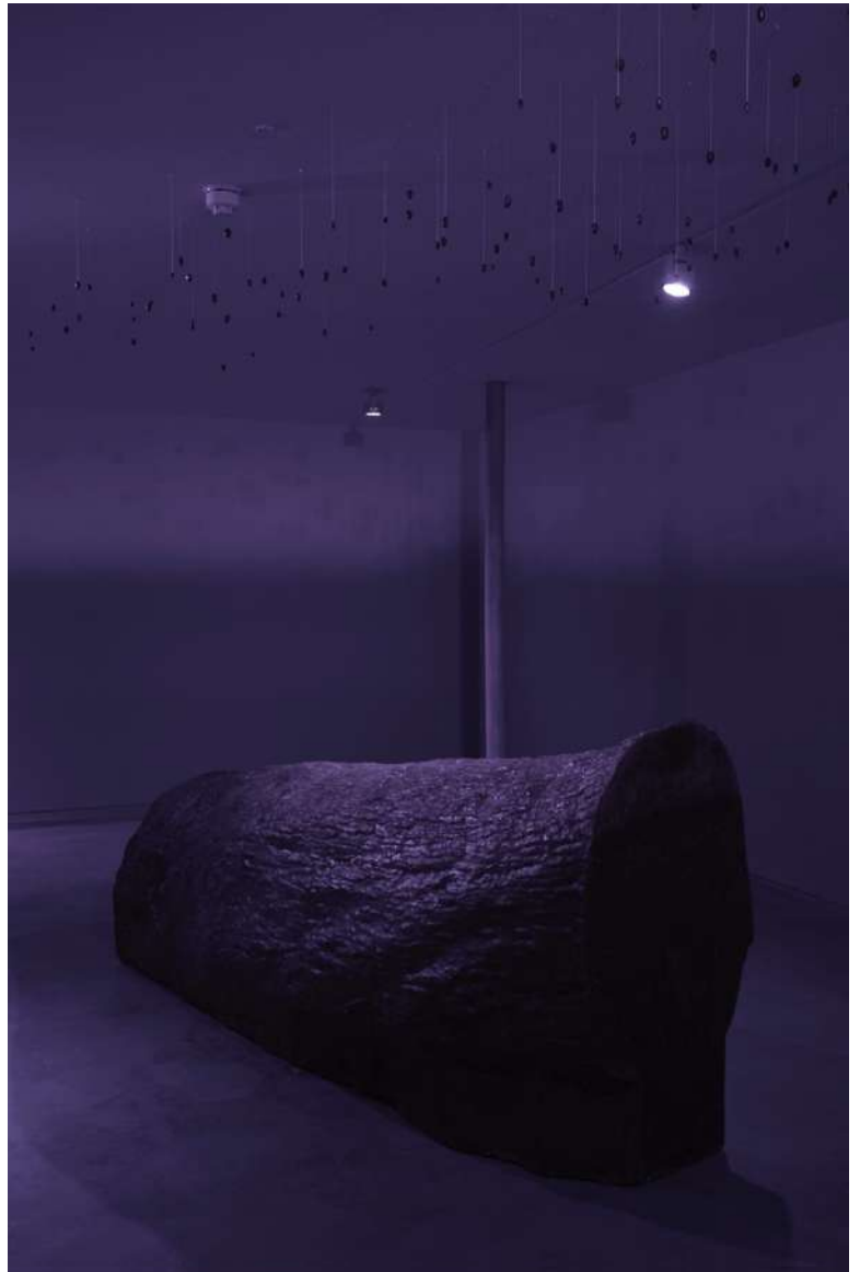
Trevor Yeung, Soapy Fuck Tree , 2023. Ευγενική παραχώρηση του καλλιτέχνη. Φωτογραφία: Andy Keate.

Έργα του συγκαταλέγονται στις συλλογές του Centre Pompidou (Παρίσι)· του Stiftung Skulpturenpark Köln (Κολωνία)· του Μουσείου Μοντέρνας Τέχνης του Παρισιού· του Ιδρύματος Kadist (Παρίσι & Σαν Φρανσίσκο)· του FRAC Alsace (Σελεστά)· M+ (Χονγκ Κονγκ)