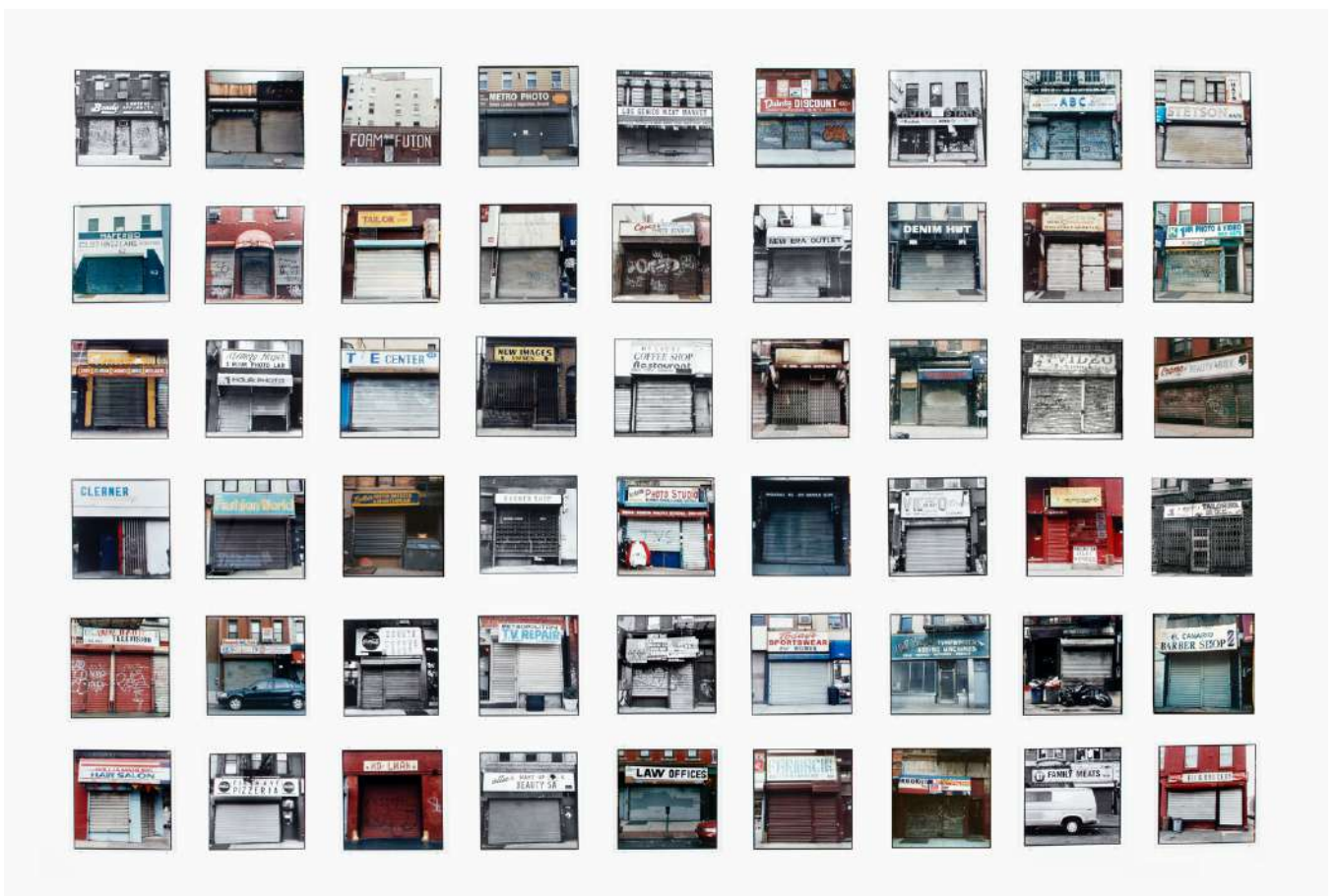
Zoe Leonard, Analogue , 1998-2009 (λεπτομέρεια), 412 χρωμογενικές εκτυπώσεις και αργυροτυπίες, 28 x 28 εκ. (η καθεμία). Ευγενική παραχώρηση της καλλιτέχνηδας και των γκαλερί Galerie Gisela Capitain, Κολωνία και Hauser & Wirth, Νέα Υόρκη.

Η Zoe Leonard (γεν. 1961) είναι Αμερικανίδα καλλιτέχνη η οποία ζει και εργάζεται στη Νέα Υόρκη. Η καλλιτεχνική της πρακτική συνδυάζει τη φωτογραφία, την γλυπτική και τις τοπο-ειδικές εγκαταστάσεις. Το έργο της Leonard έχει παρουσιαστεί εκτενώς από τις αρχές της δεκαετίας 1990. Το 2018 πραγματοποιήθηκε αναδρομική έκθεση του έργου της στο Whitney Museum of American Art της Νέας Υόρκης και στο Museum of Contemporary Art του Λος Άντζελες. Επιλεγμένες ατομικές εκθέσεις της έχουν παρουσιαστεί, μεταξύ άλλων, στους εξής χώρους: Musée d'Art Moderne de Paris, Παρίσι (2022)· Museum of Contemporary Art, Σίδνεϋ (2023)· Museum of Modern Art, Νέα Υόρκη (2015)· Chinati Foundation, Μάρφα, Τέξας (2013)· Camden Arts Center, Λονδίνο (2012)· Dia Art Foundation, Νέα Υόρκη (2008)· Museo Reina Sofia, Μαδρίτη (2008)· Kunsthalle Basel, Βασιλεία (1997)· και Vienna Secession, Βιέννη (1997). Η Leonard έχει συμμετάσχει στις διεθνείς εκθέσεις τέχνης 57 th Carnegie International (2018), Documenta 9 (1992), Documenta 12 (2007), καθώς και στην Μπιενάλε του Whitney τα έτη 1993, 1997 και 2014. Τα έργα της συμπεριλαμβάνονται σε σημαντικές δημόσιες συλλογές ανά τον κόσμο. Έχει λάβει διάφορα βραβεία όπως η Υποτροφία Guggenheim (2020)· το Graham Foundation Grant (2020)· το βραβείο Bucksbaum (2014) και το βραβείο Anonymous Was A Woman (2005).